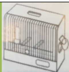
Кавез - канаринци боје: