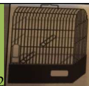
Кавез : C2